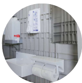
鏡付き洗面台も常備